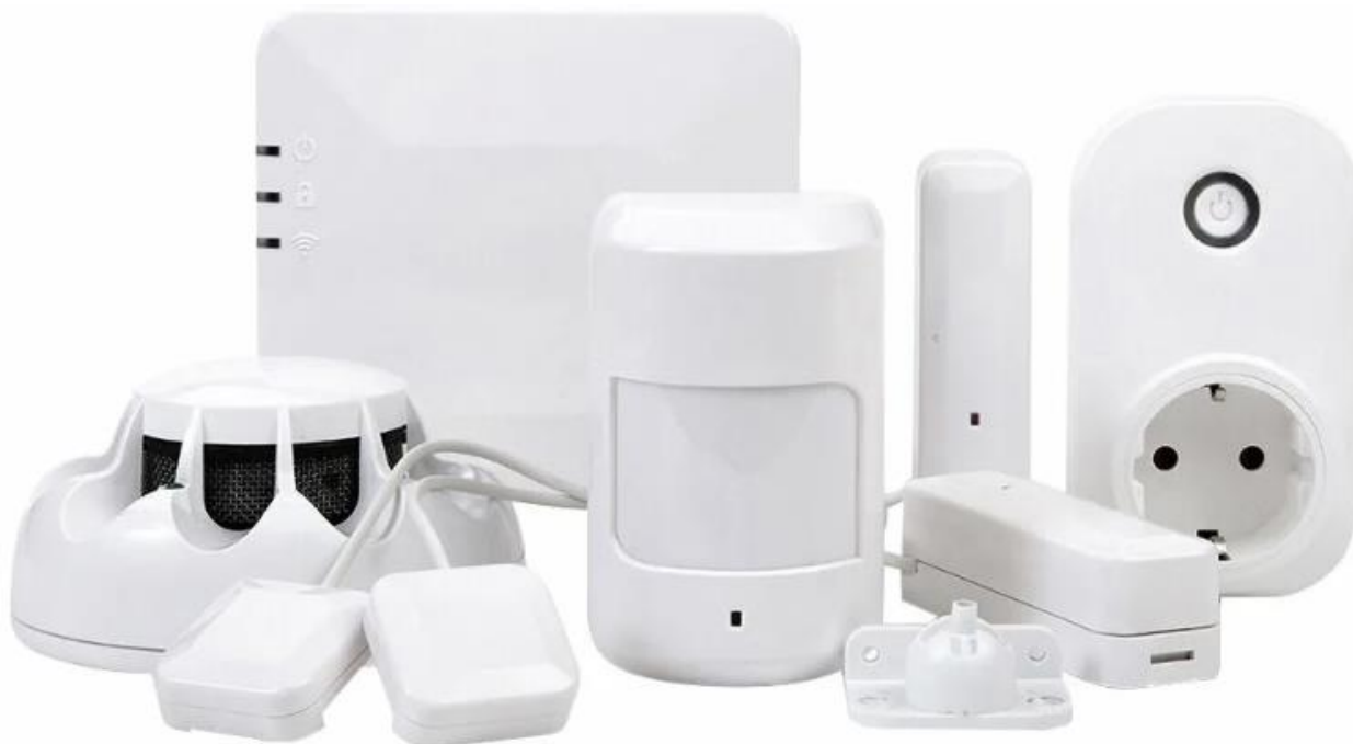
Рис. 1 Охранный блок - Livicom

Исходное состояние системы для постановки объекта под охрану.